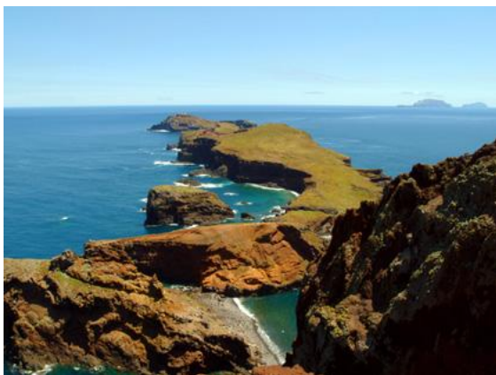
Ponta de São Lourenço