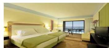
Pestana Promenade, Classic Seaview rum

270: -/person Hotel Pestana Promenade - Madeira flygplats