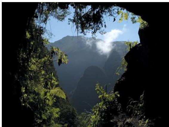
Levada Cova da Roda

Medelsvår vandring – 15 - 21 km, 5 - 7 timmar