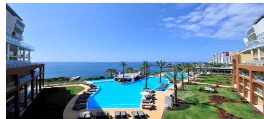
Pestana Promenade poolområde

Pestana Promenade ligger vid havet i det välkända hotelområdet Lido i Funchal. Lido området är ett lugnt område i de västra delarna av Funchal. In till de centrala delarna av Funchal går du på 20 minuter eller så tar du lokalbuss eller taxi. Hotellet har 190 rum, alla fullt utrustade med de faciliteter du kan önska dig av ett 4-stjärnigt hotell. Classic Seaview rummen har balkong och fin utsikt över havet. På hotellområdet finns utom- och inomhus pool, spa avdelning, jacuzzi, bastu, turkiskt bad, gym, två restauranger och bar. För mera information se: www.pestana.com